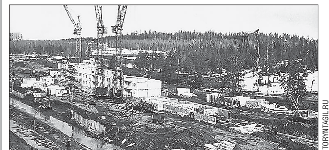
Микрорайон Пихтовые Горы в Нижнем Тагиле назвали так, потому что появился он в одноимённой лесопарковой зоне. На фото — начало 1980-х годов, строительство микрорайона продолжается