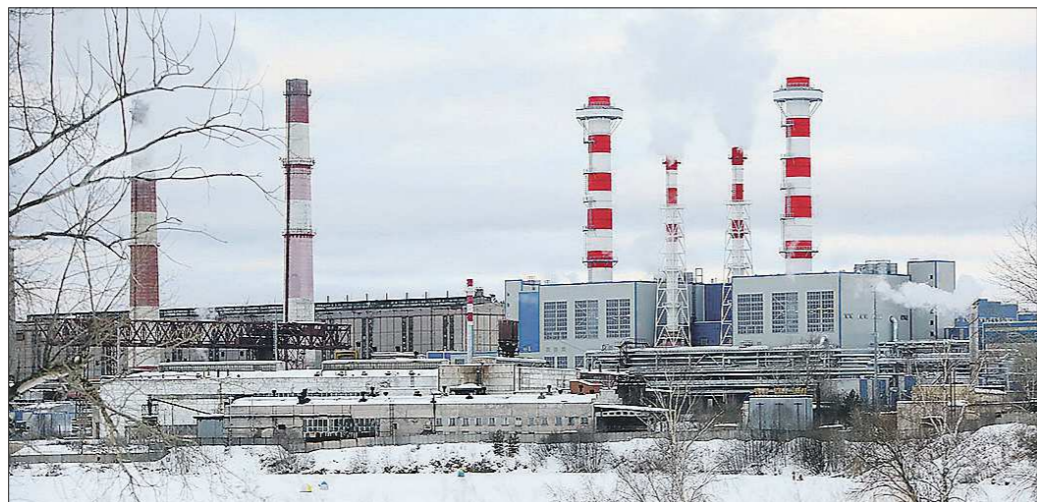
Слева старая станция, справа — новая: разница очевидна

История Нижнетуринской ГРЭС началась в 1941-м — решение о строительстве было принято Правительственной комиссией в соответствии с планами развития энергосистемы Урала на базе топливных ресурсов Богословского и Волчанского месторождений бурого угля.