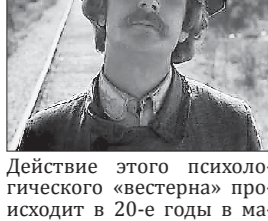
Действие этого психологического «вестерна» происходит в 20-е годы в ма-

06.00 Момент истины (16+) 06.50 Т/с «Гонимые» (16+) 10.00 Сейчас