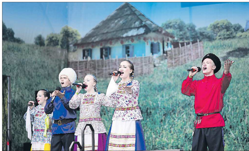
Ансамбль казачьей песни «Красный яр» — участник всевозможных народных мероприятий в Красноуфимске и за его пределами