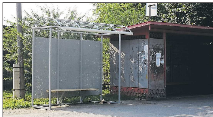
Монтажники ещё не успели установить крышу и стены на павильонах, а сальдинцы уже устроили разное новым конструкциям. Однако и старые их не устраивают: в них всегда мусорно и пахнет