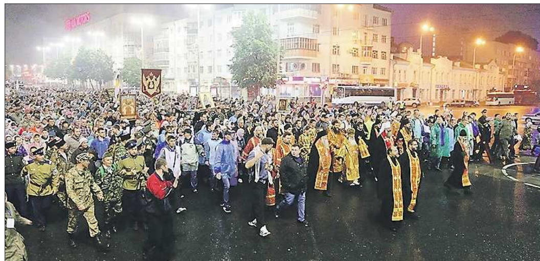
Год назад крестным ходом от Храма-на-Крови до Ганиной Ямы прошли 60 тысяч верующих

Всю неделю Царских дней будут идти торжественные богослужения в Храме-на-Крови. Но кроме этого, в программе фестиваля — много интересных событий: концерты, лекции, ярмарки, встречи. Побывать на них можно всем, кто пожелает, аб-