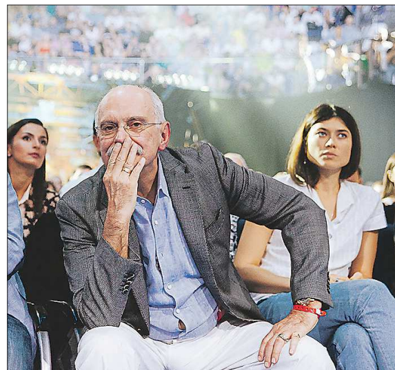
Кинорежиссёр, председатель Союза кинематографистов России Никита Михалков внимательно наблюдал за боем. Кстати, Никита Сергеевич и Сергей Ковалёв — хорошие друзья

— Я основал со своей командой в Челябинске школу бокса «Krushet» (англ. «Разрушитель» — это прозвище Ковалёва. — Прим. «ОГ»). Буду