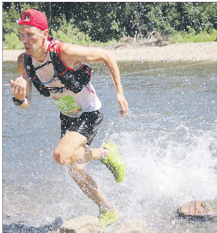
Прошлым летом накануне «Конжака» выпал снег. В этом году участники марафона ждали испытание изнурительной жарой, поэтому часть дистанции, проходящая по горной реке, была не препятствием, а приятным бонусом

— Бывали. Вообще «Конжак» в этот раз был ещё и тре-