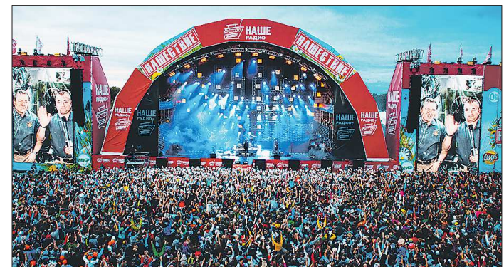
Количество зрителей побил рекорд — фестиваль посетили 205 тысяч зрителей. Прошлый рекорд — 200 тысяч человек — был установлен год назад