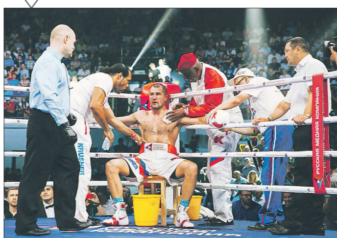
Боксёр Сергей Ковалёв остался непобеждённым — вечером 11 июля в Екатеринбурге он отстоял сразу три титула чемпиона мира в бою против малавийского спортсмена Айзека Чилембы