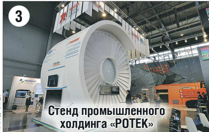
Стенд промышленного холдинга «РОТЕК»