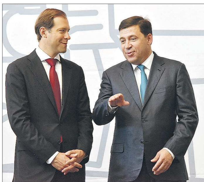
Денис Мантуров и Евгений Куйвашев считают, что открытие такого производства на Урале позволит россиянам иначе строить свои переговоры с иностранными производителями дизельных двигателей

Как пояснил Дмитрий Пумпянский, УДМЗ имеет большой опыт производства двигателей, но в течение последних тридцати лет здесь не было возможности осваивать выпуск новых моделей. Ситуация изменилась в 2013 году, когда при поддержке