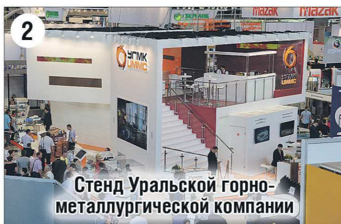
Стенд Уральской горно-металлургической компании