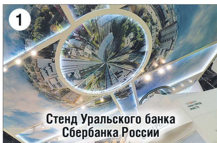
Стенд Уральского банка Сбербанка России