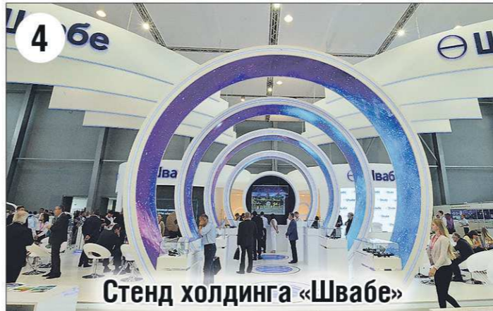
Стенд холдинга «Швабе»