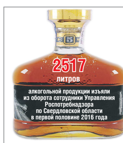
алкогольной продукции изъяли из оборота сотрудники Управления Роспотребнадзора по Свердловской области в первой половине 2016 года