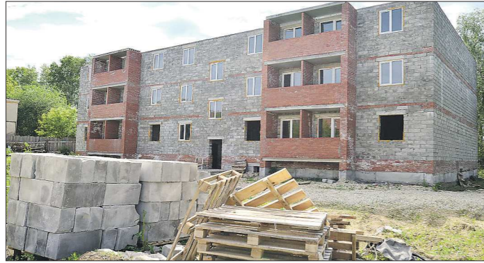
Строящийся дом в Ревде заморозили и начали возводить ещё один

Сразу в двух муниципалитетах Свердловской области появились «программные» долгостроители. Из-за проблем с застройщиками дети-сироты из Ревды и Алапаевска уже несколько лет не могут получить квартиры.