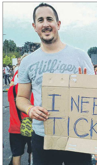
Два миланца, кажется, совсем не расстроены, что не могут попасть на матч. Им так понравилось позировать, что потом они попросили сделать такое же фото на их телефон

Простые миланцы, оказавшиеся в тех же вагонах, вынуждены были прослушать весь репертуар фанатских куплетов. Ещё одна тонкая поезда на метро в это время – пол в вагонах был так залит пивом, что обувь то и дело прилипала.