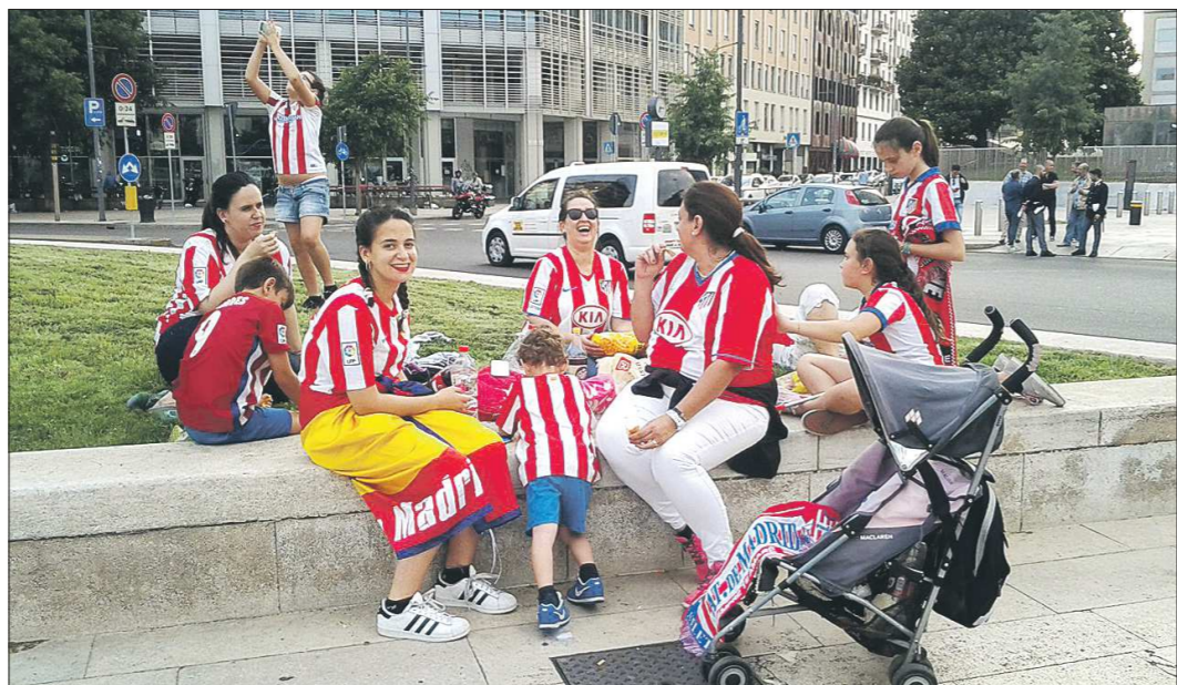
Исключительно женская группа поддержки. Все от мала до велика болеют за «Атлетико»

По воле случая оказавшись относительно близко от финала футбольной Лиги чемпионов, который прошёл в Милане в минувшие выходные, корреспондент «ОГ» не удержался от соблазна посмотреть, что происходит вокруг него. Это возможность увидеть уже сейчас примерно то же самое, что большинство из нас будут наблюдать своими глазами через два года во время матчей чемпионата мира по футболу в Екатеринбурге.