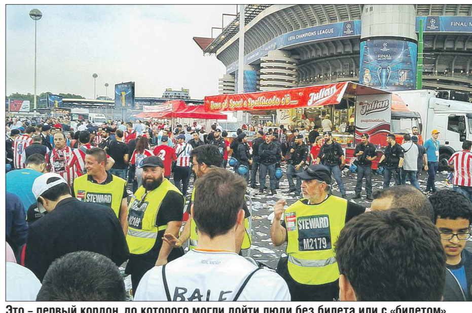
Это – первый кордон, до которого могли пройти люди без билета или с «билетом», купленным за 80 евро

Но самая большая толпа собралась возле почта-модницами всего мира старшего в Европе пассажа