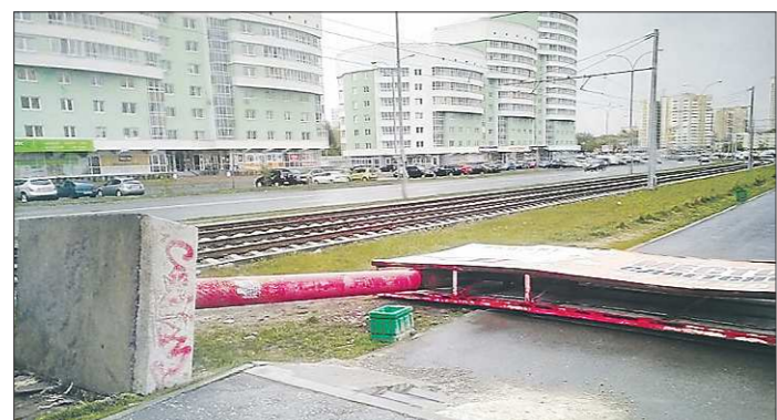
Порывы ветра были настолько сильными, что уронили на тротуар рекламный щит на Ботанике

Вчера в Екатеринбурге и соседних муниципалитетах области коммунальщики боролись с последствиями ураганного ветра, который пронёсся по области в четверг вечером. Электрооборудование восстановили уже наутро, а вот с остальными сюрпризами — упавшими рекламными щитами и вырванными деревьями — управиться уже в течение дня.