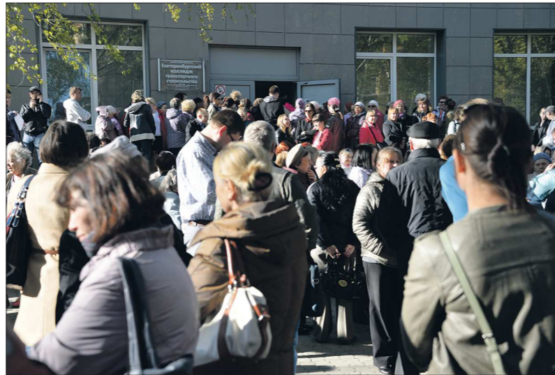
Всего на слушания пришли более 750 человек