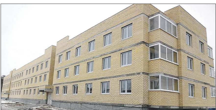
Новостройки в Арамилле тоже растут: три года назад два дома для 300 переселенцев построили на улице Красноармейской

Администрация Арамилльского ГО — одного из лидеров в реализации программы переселения — два года назад уже успешно опробовала новый способ переселения граждан — строить новый дом на месте старых барачков. Теперь, не дожидаясь попадания в областную программу, муниципалитет решил за счёт двух де-