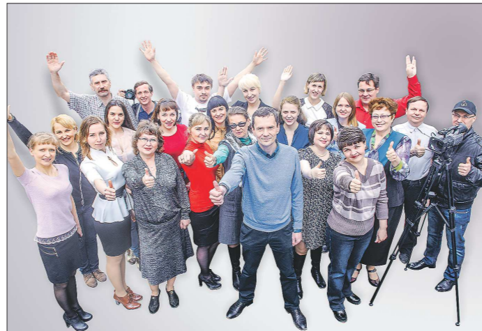
Коллектив пресс-службы ПАО «СТЗ»

Жюри оценило высокий профессионализм полевчан, яркие идеи и эффективное их воплощение. Стоит вспомнить лишь некоторые моменты 2015 года: праздник на городской катке «Рио-Рита. Танго их молодости», проект «Трубин Победу!», фестиваль народной и духовной музыки «Весна духовная», юбилей старейшей городской газеты «Рабочая правда», создание нового креативного городского интернет-портала Bajopolь.pf .