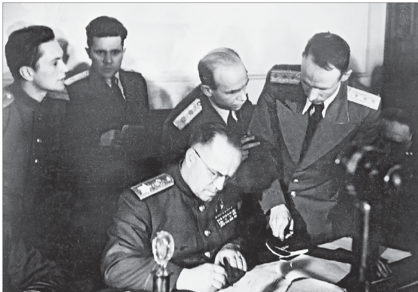
8 мая 1945 года в 22:43 (9 мая в 0:43 по московскому времени) в Карлсхорсте (Берлин) Г. Жуков принял безоговорочную капитуляцию войск нацистской Германии

В канун Дня Победы «ОГ» открывает проект «Георгий Победоносец», посвящённый 120-летию со дня рождения легендарного полководца, Маршала Победы Георгия Константиновича Жукова. Именно он подписал Акт о безоговорочной капитуляции Германии. Свои автографы Победы есть в каждом уголке нашей страны и, конечно, на Урале. Сегодня мы рассказываем о том, как запечатлелись война и Победа в истории Свердловской области, судьбах уральцев