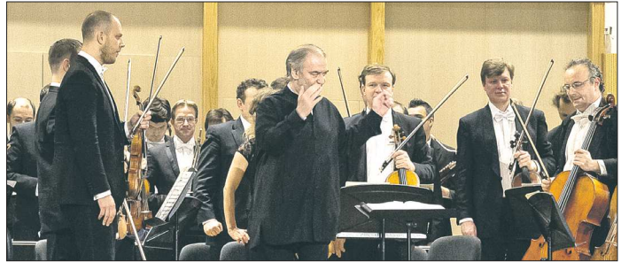
В этом году фестиваль посвящён 125-летию Сергея Прокофьева, но изначально в екатеринбургской программе произведений этого композитора не было. Удивив публику, оркестр исполнил Прокофьева на бис