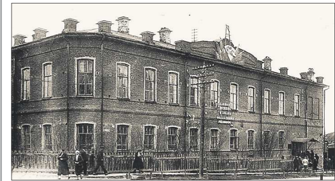
Здание пансиона считается образцом рационального «кирпичного» стиля, широко применявшегося на рубеже XIX-XX веков для массового городского строительства