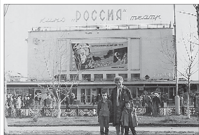
«Россия» не была единственным кинотеатром Нижнего Тагила, но сюда приезжали со всего города. Фото 1965 года