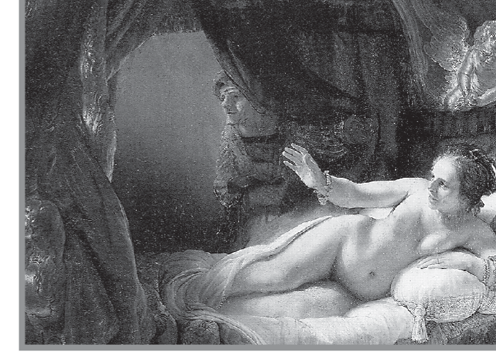
рисунок складывается ощущение, будто в помещении отсутствует несколько стен. А ведь Даная-то, по идее, была заточена в медном ящике, в подземелье, если что.

В этом году исполняется 380 лет с того дня, как великий нидерландский художник Рембрандт Харменсович ван Рейн начал рисовать свою не менее великую картину «Даная», которая сейчас хранится в етце более великом музее Эрмитаж, где её может лицезреть любой россиянин, включая скипидарцев!