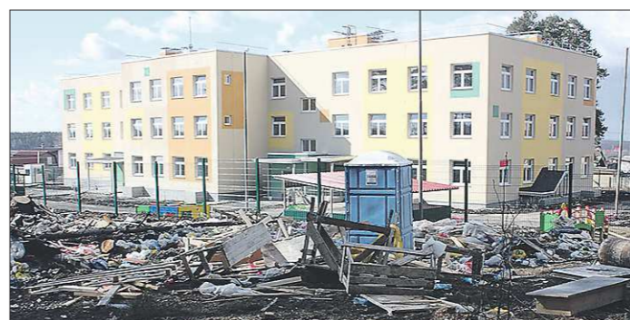
По муниципальному контракту садик в посёлке Октябрьском должен был быть сдан 1 декабря 2015 года. Так выглядела его территория в середине апреля

когда в банках накапливается слишком много денег. Именно такая ситуация сложилась и сейчас. Люди, напуганные прошлогодней инфляцией, охотно размещают свои средства на депозитах, а кредиты, наоборот, брать опасаются. Поэтому следующий логичный шаг для банков — снизить ставки по кредитам, чтобы пустить накопленные деньги в оборот.