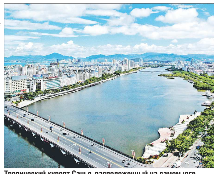
Тропический курорт Санья, расположенный на самом юге острова Хайнань, является наиболее популярным местом отдыха среди россиян в Китае

размещения. Это наличие в меню китайских блюд, чайно-ночного набора в номере, электрических розеток или переходников, подходящих под стандарт КНР, табличек на китайском языке и так далее. Как вы оцениваете готовность отелей Екатеринбурга к приёму китайских туристов?