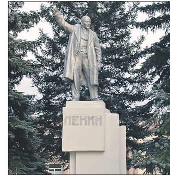
Сначала памятник Ленину каменцы планировали установить на площади 25-летия Октября (ныне — Соборная площадь), но всё же решили, что он будет уместнее в пролетарском районе рядом с заводом

Этот монумент стал своеобразным символом новой жизни для Каменска, ведь его открытие почти совпало с присвоением этому населённому пункту статуса города — с разницей всего в один день. Памятник Владимиру Ильичу установили в сквере прямо перед клубом Синарского трубного завода (сейчас на месте клуба находится центр культуры и народного творчества «Орбита»).