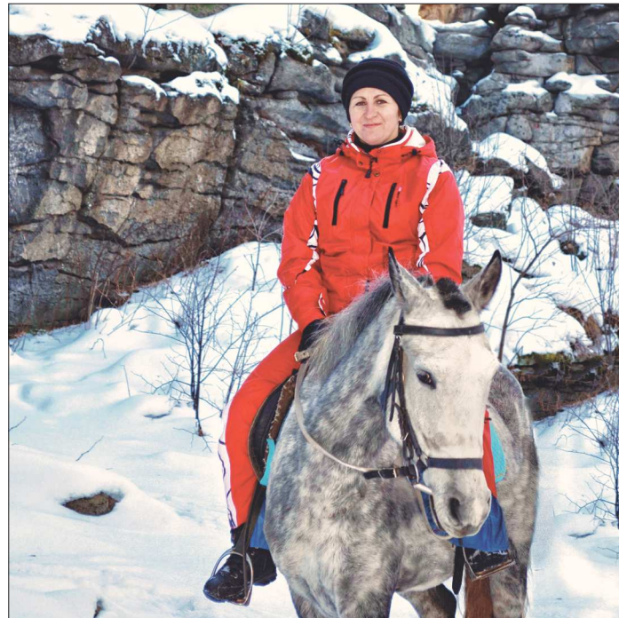
Быть «на коне» глава Верх-Нейвинского предпочитает на службе и во время отдыха. Это фото сделано в районе скал «Семь братьев»

— Семья — раз. Градообразующее предприятие — два. Неравнодушные жители посёлка — три. Семья у любого человека должна быть на первом месте, и, вступая в должность, я больше всего боюсь, что не смогу легко переквалифицироваться в психологически с роли управленца на роль хозяйки дома и обратно, чтобы родные чувствовали себя со мной комфортно и работа не страдала. Вроде бы получается. ПЦМ и для меня, и для всего посёлка — проверенная всякими надежными опора. У завода просим всё — от гвоздя до огромных проектов. В принятой недавно программе комплексного развития Верх-Нейвинского самую