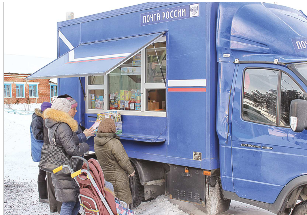
В селе Тюш Ачитского района проживает всего 218 человек. «Почта на колёсах» здесь бывает трижды в неделю

Как пояснили в пресс-службе Свердловского филиала ФГУП «Почта России», передвижные отделения обслуживают жителей малонаселённых и труднодоступных территорий. Там можно оплатить счета по квитанциям, оформить подписку, получить письмо или приобрести какую-нибудь продукцию. Штат у «почты на колёсах» небольшой — только водитель и оператор. Приходит в населённый пункт она по заранее заведённой расписке. На сегодня «почты на колёсах» работают в территориях, подчинённых Красноуральскому, Асбестовскому, Красноуральскому и Нижнетагильскому почтамтам. Почтовое отделение в Курманке перестало работать с уходом в декрет единственного почтового работника. Чтобы оплатить квитанции, местным жителям приходилось просить о помощи зна-