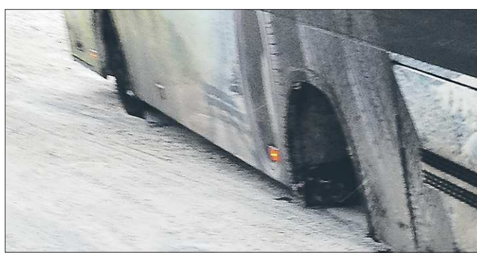
Одно колесо отвалилось у автобуса прямо во время движения