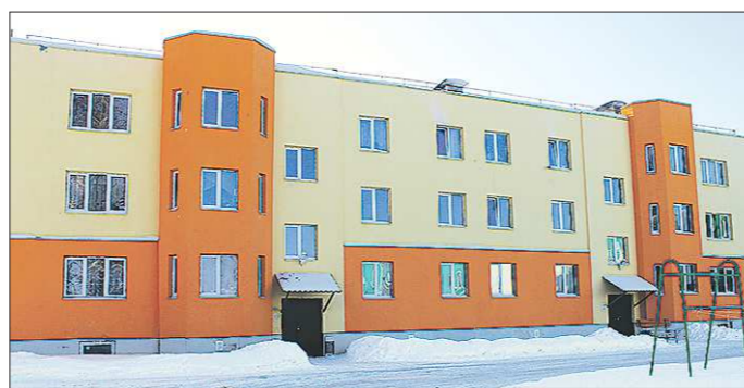
Внешне дома выглядят презентабельно, если бы не странная планировка...

В прошлом году «ОГ» нашла в одном из бывших общежитий Екатеринбурга самую крошечную жилую комнату области — размером в 6 квадратных метров.