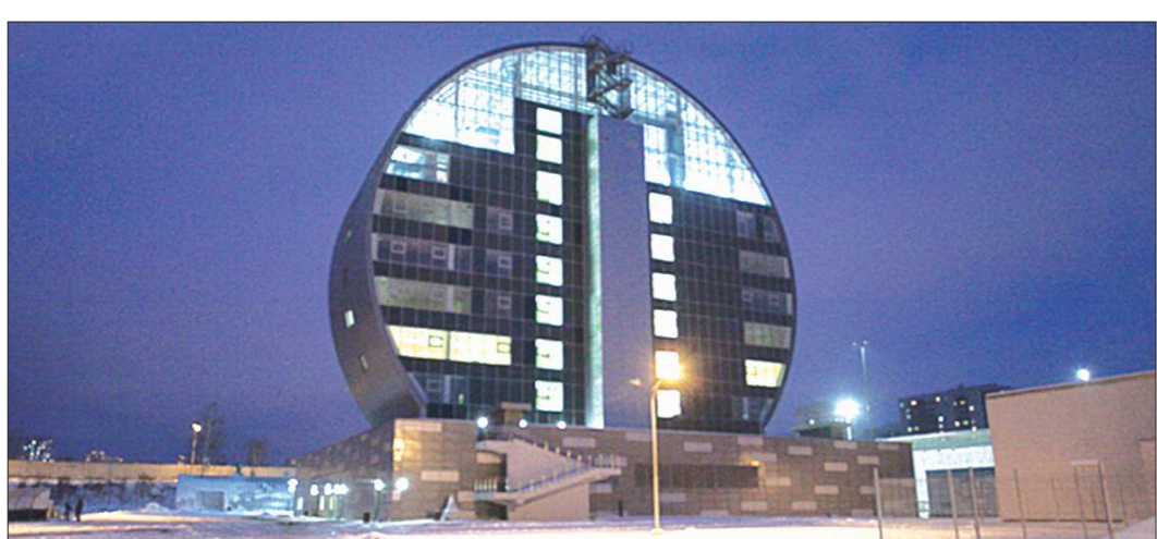
Адрес Инновационного культурного центра в Первоуральске – ул. Ленина, 18. Площадь необычного здания составляет 7 532 квадратных метра

– ...О чём очень жалею! Вот честно скажу: я каждый понедельник собираюсь начать новую жизнь, её обязательно будет время для физической активности. Просто времени почти не остаётся на спорт... Но это неправильно. Так что надеюсь, что этот понедельник обязательно наступит!