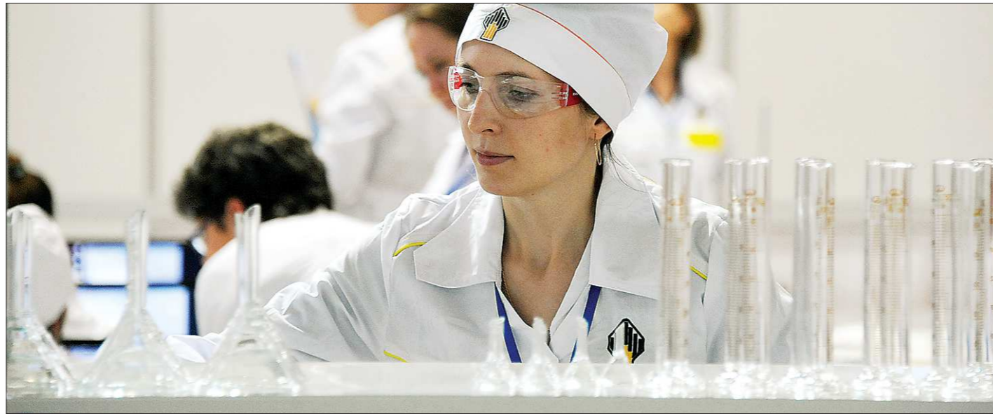
В консорциум вошли пять научно-исследовательских институтов: химии твёрдого тела, органического синтеза, математики и механики, иммунологии и физиологии человека, геологии и геохимии, а также УрФУ, УГМУ и Уральский фармкластер

Вообще-то девятой планеты считался Плутон. И именно Майкл Браун инициировал для него процедуру импичмента на Астрономическом конгрессе в 2006 году. Браун назвал Плутон планетой-карликом, чей диаметр всего около трёх тысяч километров (на 500 километров меньше диаметра Луны), а через 10 лет объявил о новой девятой планете.