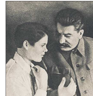
В Свердловске Мария рассказала в том числе о встрече со Сталиным