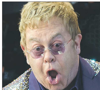
Элтон Джон сильно удивился звонку Президента РФ