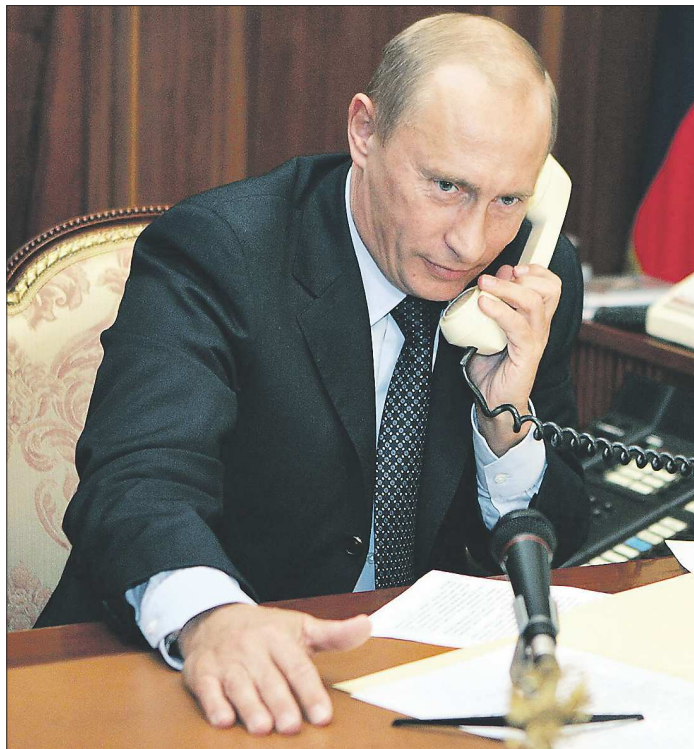
Узнав о розыгрыше, Владимир Путин действительно позвонил Элтону Джону...