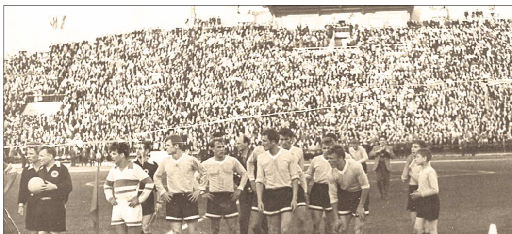
1969 год. Единственный сезон «Уралмаша» в высшей лиге чемпионата СССР. В первом домашнем матче свердловчане обыграли бакинский «Нефтьчик». Трибуны Центрального стадиона заполнили рекордные для того сезона 30 000 зрителей

Д.К.: Особенно когда игры проходят вечером и в рабочие дни. С этим могу согласиться.