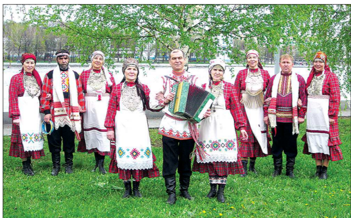
Участники ансамбля «Азвесь гур», как и «Бурановские бабушки», любят фольклорные песни на родном удмуртском языке.

ТАБАНИ: Понадобится 400 граммов пшеничной муки, 200 граммов молока или воды, 50 граммов масла, 1 яйцо, 20 граммов дрожжей, соль по вкусу.