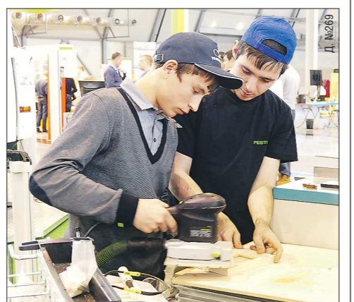
Ребята на чемпионате WorldSkills осваивают навыки профессии плотника

Конечно, дружба наша продолжится и дальше, уже решено, что в феврале заводчане придут к ребятам в гости. Причём придут молодые парни из цехов, чтобы сразиться в футбольном матче. Заводчане не хотят ограничиваться только подарками, они стремятся показать, как можно жить, как справляться с трудностями, какие усилия приложить, чтобы исполнить свою мечту. Заводчане хотят быть помощниками и наставниками для ребят, помочь им определиться в жизни, показать, чего можно добиться и как живут обычные люди. Для завода это новая и непривычная форма общения, и заводчане очень надеются, что смогут помочь ребятам сделать правильный жизненный выбор.