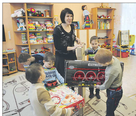
Радость от подарков

Три года назад подарки для ребят, оказавшихся в трудной жизненной ситуации, собирали и передавали организаторам акции «Ёлка желаний». В прошлом году решили в один из детских домов подарки привезти самостоятельно. Так и завязалась дружба между заводчанами и ребятами — сначала уралхиммашевцы приехали в гости в Невьянский детский дом, а потом и ребята побывали на заводе. Мы выбрали самый отдаленный от Екатеринбурга детский дом, который не слишком обладал вниманием спонсоров. На тот момент в Невьянском детском доме проживали пять десятков детей, которые очень тепло встретили заводчан. Вручать подарки отправились активисты заводской молодежной организации «ПРОдвижение», которые вернулись из поездки, переполненные впечатлениями. Решено было связать с ребятами не только в общении, а с целью посмотреть, какие специальности востребованы на заводе, узнать, как их получить, где надо учиться, как потом можно на завод устроиться. Путешествие по заводским цехам проходило очень эмоционально: многие заводчане по своему почину купили конфеты и шоколадки, дарили их детям просто мешками. Экскурсия была