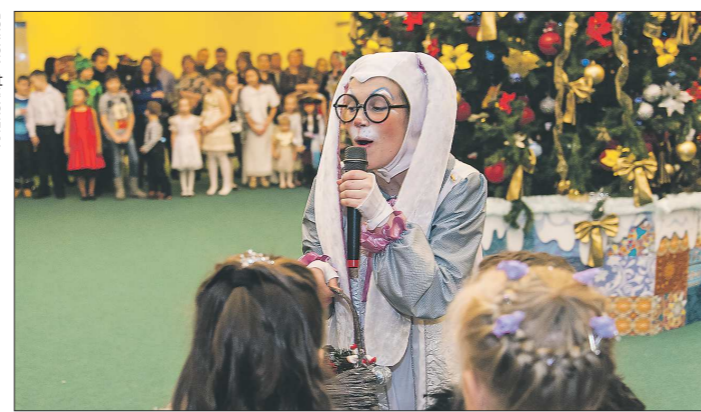
Уже 20 лет проходят ёлки в резиденции губернатора. Около пяти тысяч новогодних подарков получают здесь дети со всей области — из малообеспеченных семей, победители различных конкурсов и олимпиад