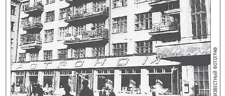
Помимо прочего, «Гастроном № 1» был знаменит своими размерами: он занимал две трети пространства улицы Вайнера на отрезке от проспекта Ленина до улицы Мальшева. Это был самый большой магазин области