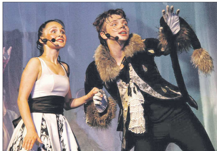
Учебные спектакли ЕГТИ не раз становились номинантами и лауреатами театрального фестиваля «Бравы»

— А как вам такое определение — энергия? Оно ведь не противоречит вашему? Заразительность — это чья-то свободная энергия, которая тебя обволакивает, захлестывает, увлечает. Но, думаю, и вы согласитесь со мной: талант — дар свыше. И вот этот «канал» с тем, что свыше, должен быть всегда открыт. Иначе творческая состоятельность угасает. Знаете, у меня в ректорском кабинете, под