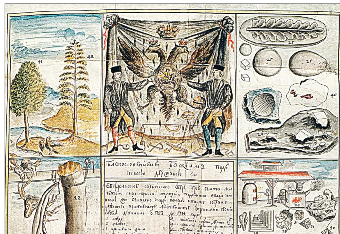
Описание трудов сибирского обер-бергмата при генерале де Геннине – иными словами, что при основателе Екатеринбурга было изучено, собрано, сделано. В описании, например, указаны лиственные и кедровые деревья (вверху слева), руда (справа)...