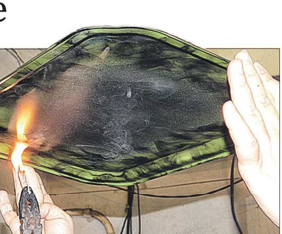
Тагильский поднос сегодня отличает фирменный фон – с помощью бересты мастера делают «чёрный» – коптят слой краски, для того чтобы добиться необычного эффекта. Процесс очень трудоёмкий, художники «Тагильской артели» практически единственные, кто это делает