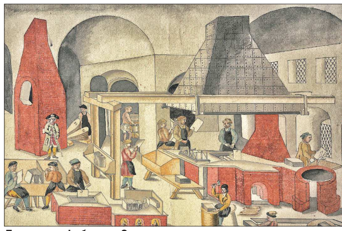
Лудильная фабрика. «Содержать квасы в однодонных кадках... и в оные кадлы для квашения чёрную жель, чтобы она была чиста и железны на ней не было. По отбиранию печь, насыпая угля, разжечь огнём. (...) И как распотлила, то взьяв жести в клещи листов 80, спустить в котёл олово... потихоньку» – так этот процесс описывал сам Вильгельм де Геннин