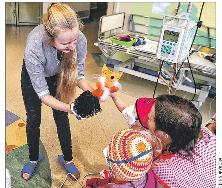
Волонтеры и сотрудники больницы знакомят малышей с героями сказок