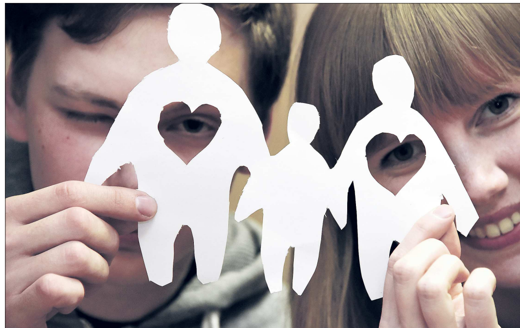
Кoeffициент рождаемости в Свердловской области достиг 14,5 на тысячу населения, что выше аналогичного показателя по России (13,3 на тысячу населения)

— В целях признания заслуг в воспитании детей знаками отличия Свердловской области «Материнская доблесть» различных степеней награждены более 2 тысяч 800 женщин, родивших или усыновивших и воспитав-