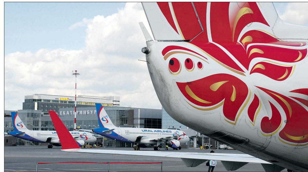
В десятке самых популярных направлений по числу перевезённых пассажиров (по убыванию): Москва, Анталья, Санкт-Петербург, Сочи, Симферополь, Хургада, Шарм-эль-Шейх, Новосибирск, Душанбе и Бишкек

Облюбовали наш регион и низкокбоджетные перевозчики — так называемые лоукостеры, которые предлагают низкие цены на свои маршруты при минимуме набора услуг (например, отсутствие питания на борту). Так, авиакомпания «Победа» раньше летала из Екатеринбурга в Москву и в летний сезон в Сочи, а с 24 октября открыла также рейсы в Санкт-Петербург и Новосибирск. При этом в пресс-службе Кольцово затруднились ответить на вопрос, сколько лоукостеров сегодня присутствует в нашем регионе, поскольку само понятие «низкокбоджетный перевозчик» законодательно не определено, а договоры у аэропорта со всеми авиакомпаниями одинаковые. Кто-то лоукостерами называет и Flydubai, и Finnair.