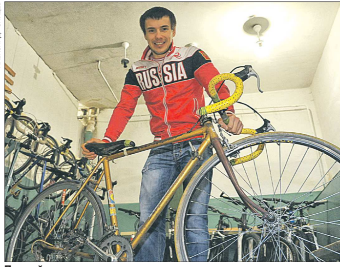
Первый велосипед гонщика до сих пор на ходу, как и три следующих, на которых он тренировался в спортивной школе