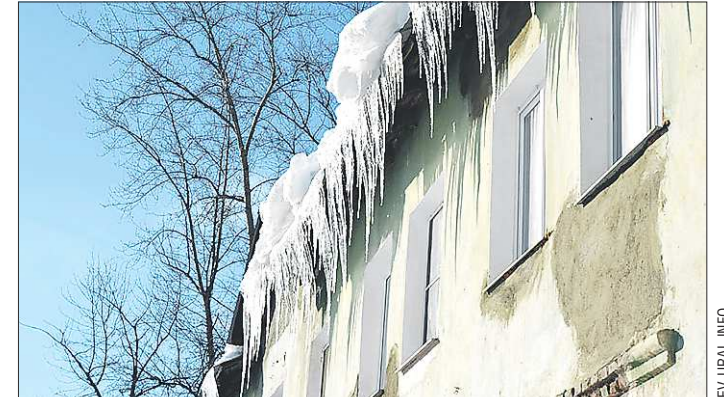
Зима на севере области началась осенью