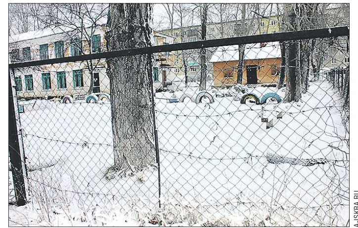
В садике говорят, что использовали колючую проволоку из соображений экономии: деревянный или металлический забор обошлись бы в разы дороже

Руководство одного из дошкольных учреждений Алапаевска решило бороться с хулиганом, которые портят забор, оригинальным способом: ограждение заткнули... колючей проволокой, сообщает «Алапаевская искра».