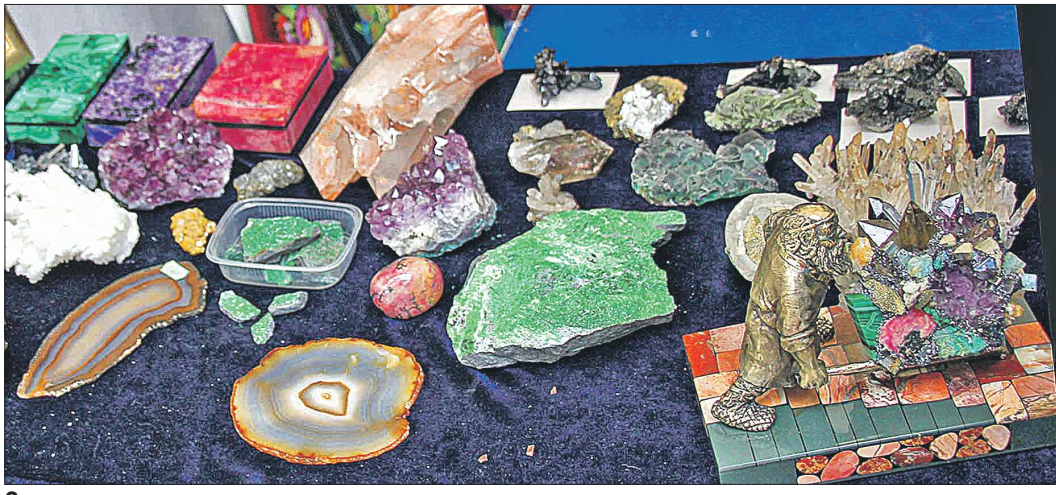
Сегодня на выставках и ярмарках можно увидеть украшения и сувениры, которые сделаны якобы из уральских камней. Да только эти камни на Урале уже давно не добывают