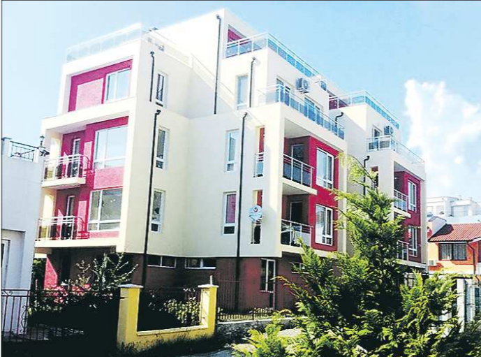
Государству придётся сильно исхитриться, чтобы выявить владельцев зарубежной недвижимости

— Если через какое-то время к этому человеку возникнут претензии со стороны любых органов, он может обратиться в Федеральную на-