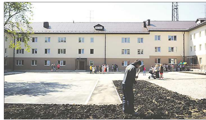
Большинство новосёлов заехали в дом два месяца назад. С 1 августа бараки, из которых переселяли людей, начали сносить

Уже в пятнадцатой программной новостройке региона только что заселившиеся жильцы обнаруживают плесень. Речь идёт о трёхэтажном доме в Ревде, построенном для переселенцев из ветхого и аварийного жилья. Такие дома в обязательном порядке должны проверять спецкомиссия губернатора.