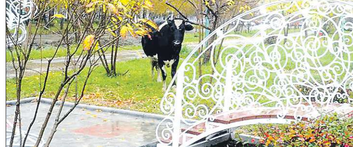
В минувшие выходные в Ревде появилась Аллея влюблённых. На открытие заглянула сплывшаяся неподалёку корова

представляют опасность и для жителей, ведь среди животных есть агрессивные особи. Например, в Черёмухово (Североуральский ГО) жители улицы Матросова этим летом терроризировали злобный бык.