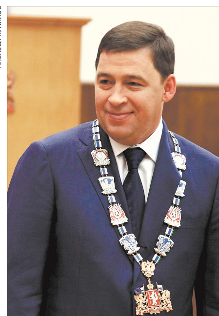
Евгений Куйвашев (2012)