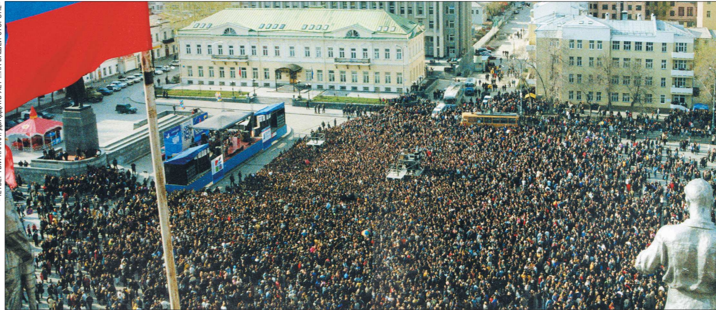
2010 год. Екатеринбург, площадь 1905 года. Самый массовый концерт в истории Среднего Урала. На сцене — «Чайф»

29 сентября 1985 года свердловская группа «Чай-Ф» (тогда её название писалось ещё так) дала во Дворце культуры ИЖК свой первый концерт. Именно эту дату музыканты считают днём рождения группы. Все эти 30 лет она остаётся одной из самых востребованных в России и легко собирает целую площадь поклонников