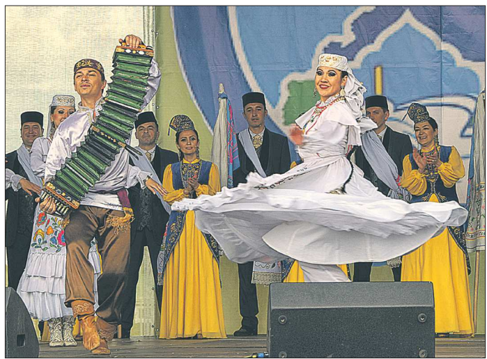
Сабантуй – татарский праздник, который проходит сразу на 37 площадках Среднего Урала