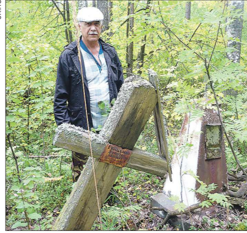
К тавдинцу приезжают жители других городов России, вместе с ними он выезжает на места захоронений