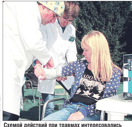
Схемой действий при травмах интересовались и дети, и родители