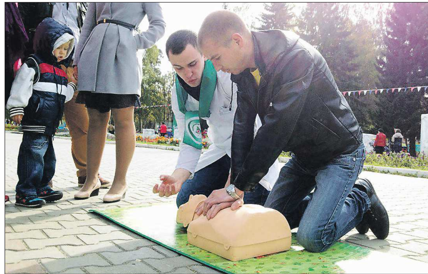
За два часа студенты-медики обучили первой помощи около ста человек

Салдинцы от участия в судьбе природного памятника, выживающего в городской среде, не самоустранились. Они проводят многочисленные акции по наведению порядка в роще, высаживают молодые деревья.