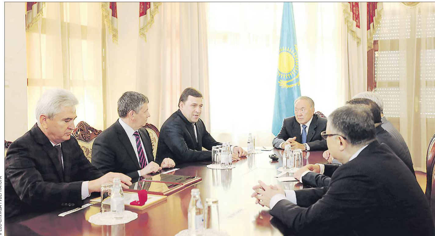
Перспективы сотрудничества с Казахстаном уральская делегация, которую возглавил губернатор Свердловской области Евгений Куйвашев (третий слева), обсудила непосредственно с Президентом Республики Нурсултаном Назарбаевым

Выступая вчера на XII Форуме межрегионального сотрудничества России и Казахстана в Сочи, Президент РФ Владимир Путин назвал Свердловскую область одним из четырёх регионов-лидеров по торгово-экономическим связям с нашим южным соседом