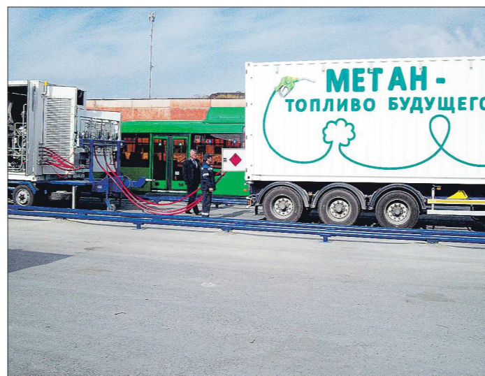
Передвижной газозаправщик «Титан-4» вмещает в себя 10 тысяч кубометров природного газа

Но до той поры без автогазозаправщиков не обойтись.