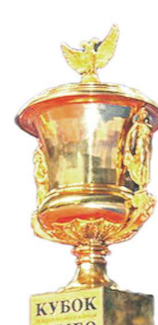
Так выглядит Кубок Президента. Пока получить его удавалось лишь команде внутренних войск

– В этом году была очень хорошая поддержка болельщиков, организация на уровне: всё просчитано, продумано – ну просто, как в хорошей схватке. Очень жаль, что Владимир Путин не приехал. Мне приятно, что президент нашей страны поддерживает боевые искусства. Конечно, если говорить о