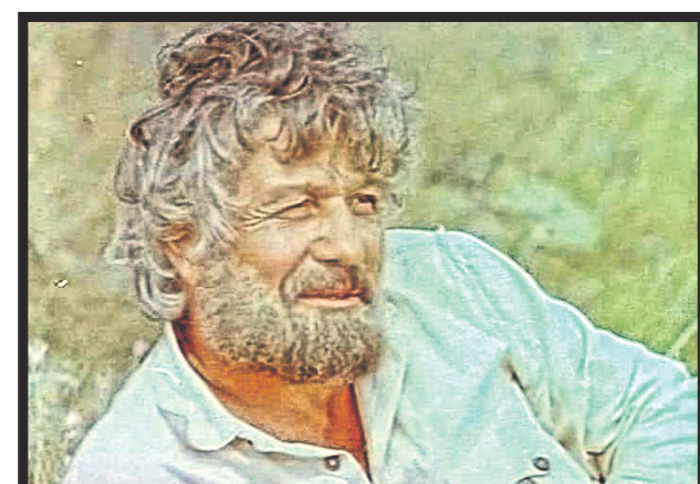
Михай Волонтир считал, что у него были роли лучше, но страна полюбила его Будулая