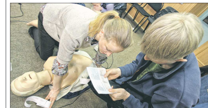
Сегодня бесплатных курсов по оказанию первой помощи в Свердловской области нет, но, как правило, эти навыки можно получить в школе на уроках ОБЖ или на парах медицины в колледжах и вузах