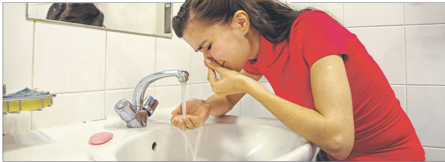
Перейти на закрытую схему планируют к 2022 году. А пока остаётся одно: открывая кран с горячей водой, зажимать нос...

В уральских вузах такая практика применяется впервые. Как удалось выяснить «ОГ», ни в Уральском государственном экономическом университете, ни в Медицинском университете, ни в Уральском лесотехническом университете, ни в Горном университете, ни в Уральском педагогическом студентом не возвращают деньги, потраченные на ремонт комнаты. Учащиеся клеят обои, стелят линолеум и нередко даже покупают необходимую мебель за свой счёт. Единственное, что может предложить вуз – закрепить конкретную комнату за студентом на весь срок обучения, чтобы через год не пришлось также облагоураживать уже другое помещение.