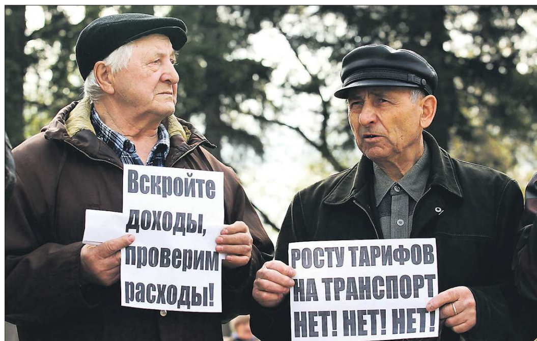
Несмотря на настойчивые просьбы общественности и депутатов, администрация Екатеринбурга так и не показывает структуру доходов и расходов на транспорт