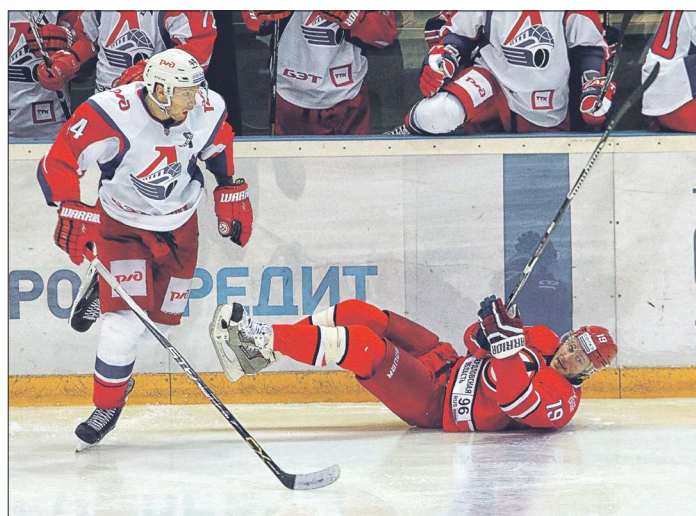
Ярославский «Локомотив» оказался в этом заезде быстрее екатеринбургского «Автомобилиста» и прервал пятиматчевую победную серию нашей команды

В случае победы в основное время «Автомобилист» мог установить новый клубный рекорд – шесть трёхочковых побед подряд. Не получилось. Но по тому, как складывалась эта игра, и одно очко, добытое в турнирную копилку, уже большое достижение. Дело в том, что в подобной ситуации (0:2 по ходу первого тайма) «Автомобилист» за время выступления в КХЛ