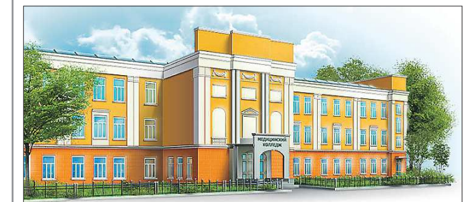
В 2014 году Свердловский медколледж стал лауреатом конкурса «100 лучших ССУЗов России»